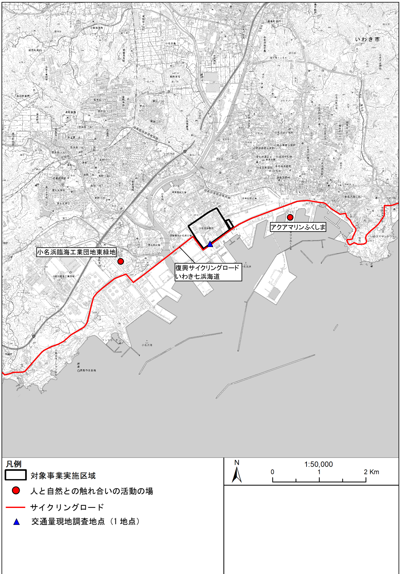
図 6.12-1 主要な人と自然との触れ合いの活動の場の位置